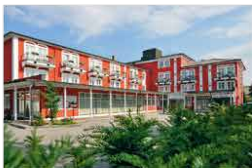
Außenansicht, 3+ Hotel Füssinger Hof

Freizeit/Kur/Unterhaltung: Entspannung finden Sie u.a. auf der Liegewiese oder in der hoteleigenen Therapieabteilung, wo Ihnen gegen Aufpreis unterschiedliche Massagen angeboten werden. In der größten Therme Deutschlands, der Johannesbad Therme, stehen Ihnen zahlreiche Becken im Innen- und Außenbereich zum täglichen Thermalbaden kostenfrei zur Verfügung.