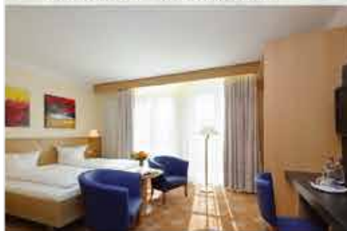
Zimmerbeispiel, 3+ Hotel Füssinger Hof